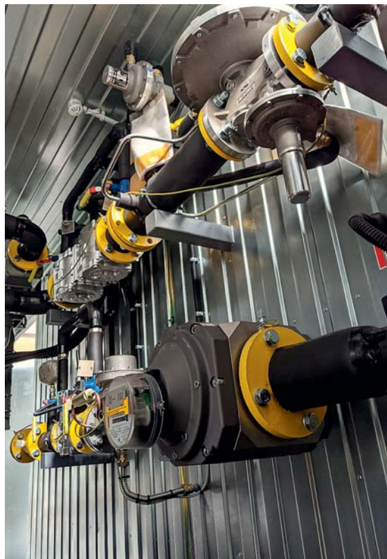
➤ Газовая раampa ЭТС-W1560

Кроме того, в ESM2 предусмотрена возможность его интеграции с платформой myPlant.