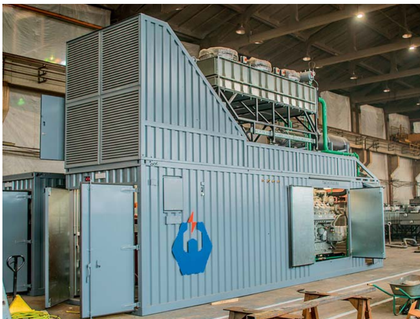
Газопоршневой энергоблок ЭТС-W1560 в сборочном цехе

Наиболее востребованная функция myPlant – предиктивная аналитика, которая дает рекомендации для технического обслуживания узлов двигателя не по установленным регламентам, а по их фактическому состоянию, а также прогнозирует нештатные ситуации на основе технологии BigData. Такие подходы передают функции мониторинга и анализа под контроль искусственного интеллекта, освобождают оператора от выполнения рутинных задач и в конечном итоге упрощают механизмы принятия решений.